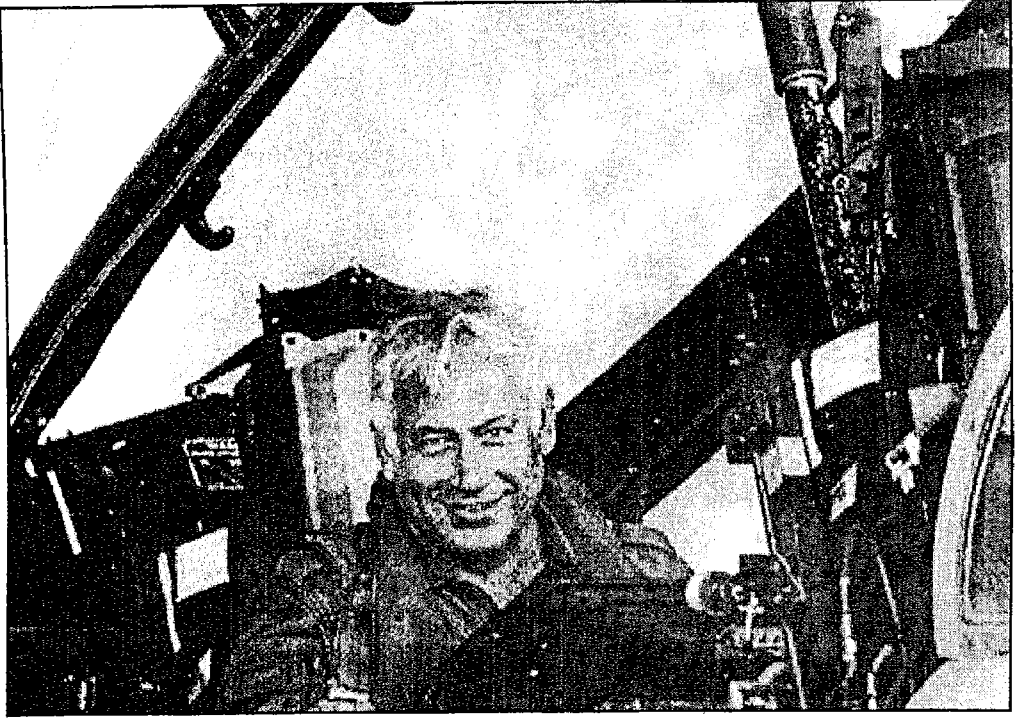
نتياهو .. الشيطان الجديد داخل طائرة حربية أمريكية تابعة للسلاح الجوي الإسرائيلي